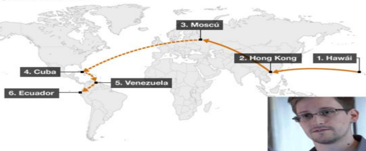
El trayecto de Snowden

"No estamos hablando aquí de un gran número de naciones dispuestas a hacerlo".