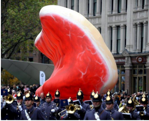
Cortar un filete, un acto no tan inocente para el planeta

En España, las cabezas de ganado emiten a la atmósfera casi el 60% del metano, un gas con una capacidad de efecto invernadero 23 veces superior a la del dióxido de carbono, ha indicado a EFE Fernando Estellés, ingeniero agrónomo de la Universidad Politécnica de Valencia.