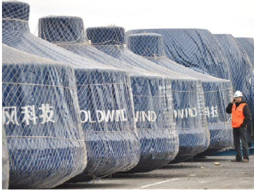
Las torres aeronegeradoras.

En el Puerto de Lirquén ya comenzó la descarga y el almacenamiento de las 22 torres de aerogeneración que están destinadas al Parque Eólico Cuel, que se emplazará en la Provincia del Bío Bío y que producirá 33 MW.