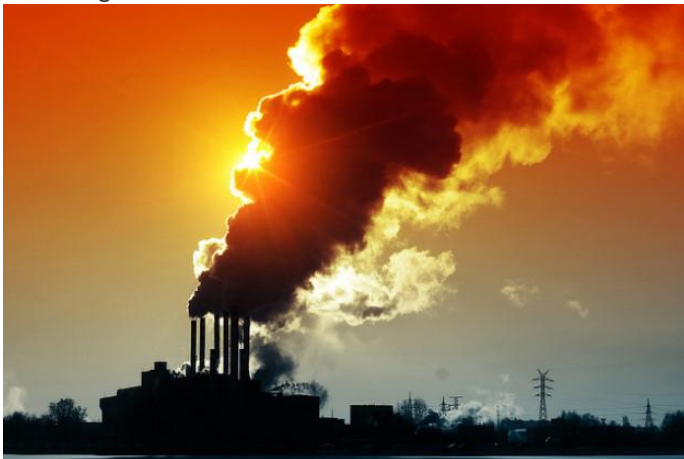
Washington y Beijing investigarán sobre tecnología para la “captura de carbono” en las plantas a carbón.

Washington, EEUU, viernes 19 de julio de 2013, por Carey L. Biron, IPS.- China y EEUU más cerca contra el cambio climático. China y Estados Unidos acordaron un conjunto de iniciativas que podrían ayudar a reducir las emisiones de gases de efecto invernadero de sus respectivas economías, las más grandes del mundo y las más contaminantes. Organizaciones ambientalistas aplaudieron la noticia inicial del acuerdo alcanzado entre el miércoles 10 y el jueves 11 de este mes. Además, parece que las relaciones entre las dos potencias mejoraron un poco, lo que podría servir de base para una nueva cooperación importante en las negociaciones internacionales sobre cambio climático.