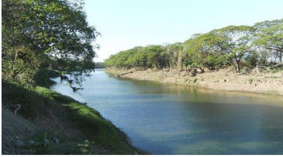
Rio Tempisque en Costa Rica.