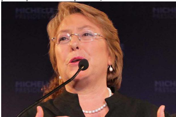
La candidata presidencial de la Nueva Mayoría Michelle Bachelet.

Santiago, Chile, viernes 19 de julio de 2013, El Mercurio.- Bachelet descarta cita con Capriles: No nos podremos juntar por problemas de agenda. La candidata presidencial además calificó como "correcta" la decisión del PPD de bajar la candidatura del ex ministro Víctor Manuel Rebolledo. "Chile requiere de la política pero de buena política", sostuvo.